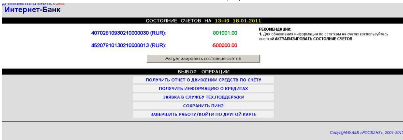
Рисунок 3. Страница главного меню системы «Интернет-Банк».

После ввода значения ПИН2-кода в поле «ПИН2» и нажатия на кнопку «Ввести данные в СИСТЕМУ» Вы перейдете на страницу главного меню системы «Интернет-Банк» (рисунок 3).